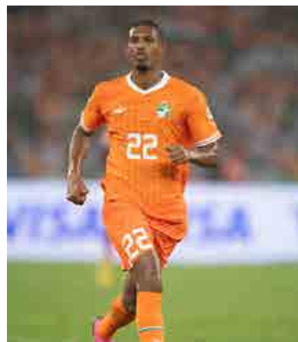
Rendez-vous pour la prochaine Coupe d'Afrique des Nations de football, au Maroc, à l'été 2025.